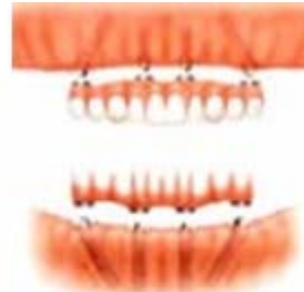
Simulazione di consegna delle protesi dopo l'inserimento impianti

Una volta realizzata al computer la pianificazione desiderata si potrà costruire, con la tecnica cad/cam, una guida chirurgica in resina dura con dei fori rivestiti da cilindri metallici, che fungono da tragitto obbligato per l'inserimento degli impianti, la cui posizione e profondità saranno esattamente le stesse realizzate virtualmente al computer.